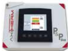
P&P BOX DÉFORMATION