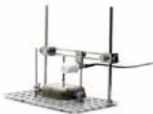
SUPPORT ET CAPTEUR DE DÉFORMATION