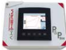
P&P Box TEMPÉRATURE