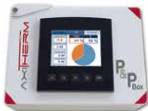
P&P Box EXPERT