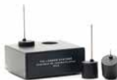
SONDE EMBARQUÉE PHILOG