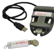
CAPTEUR MINIATURISÉ AXIMINI ET AXIMICRO